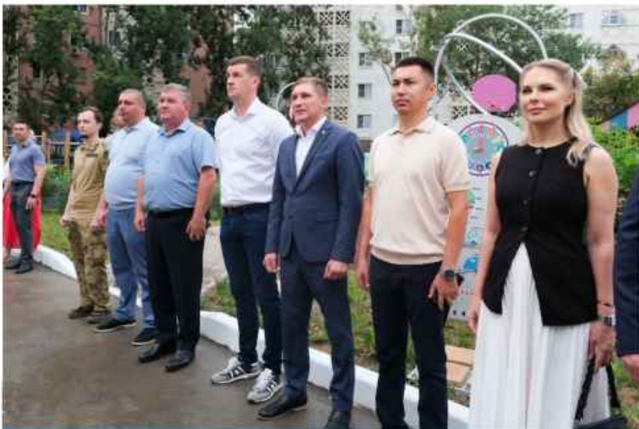
МБДОУ г. Астрахани "Детский сад №1"